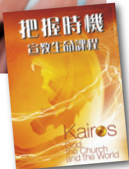
「把握時機」宣教生命課程